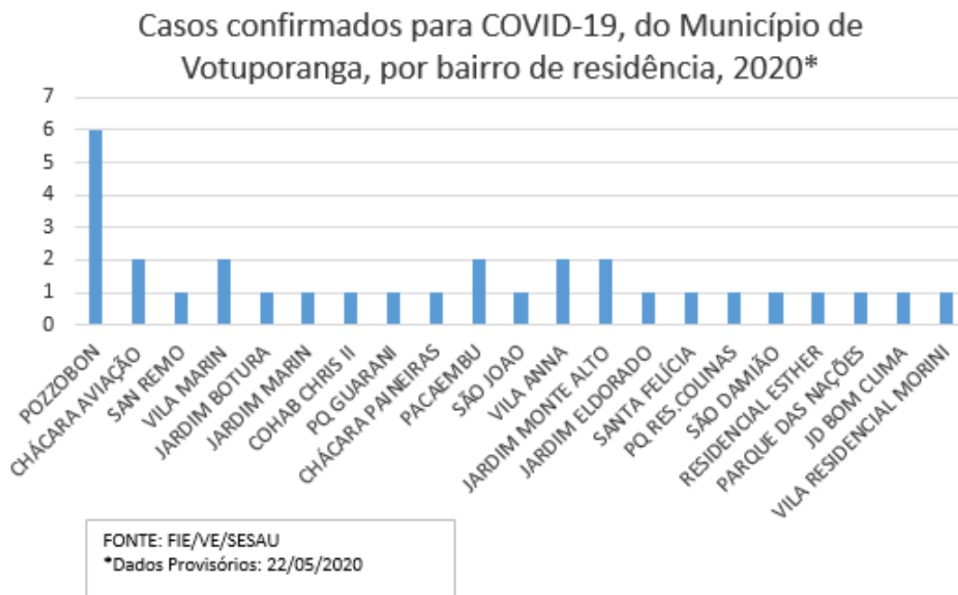
Gráfico de Distribuição dos casos Positivos para COVID-19, residentes no Município de Votuporanga, por bairro, período Março, Abril e Maio/2020

Na tabela 2 é apresentado o total de Profissionais de Saúde notificados como suspeitos de COVID-19, que aguardam resultado de exame, por faixa etária.