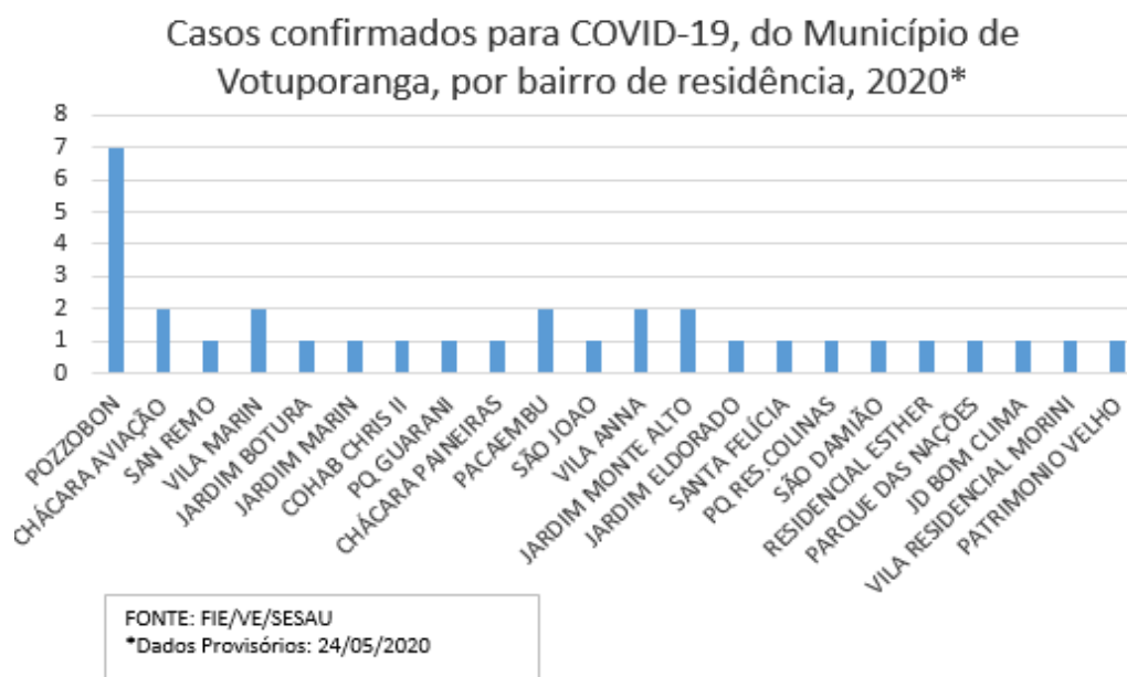
Gráfico de Distribuição dos casos Positivos para COVID-19, residentes no Município de Votuporanga, por bairro, período Março, Abril e Maio/2020

O município de Votuporanga, no dia de hoje, não registra casos de Profissionais de Saúde notificados como suspeitos de COVID-19, que aguardam resultado de exame.