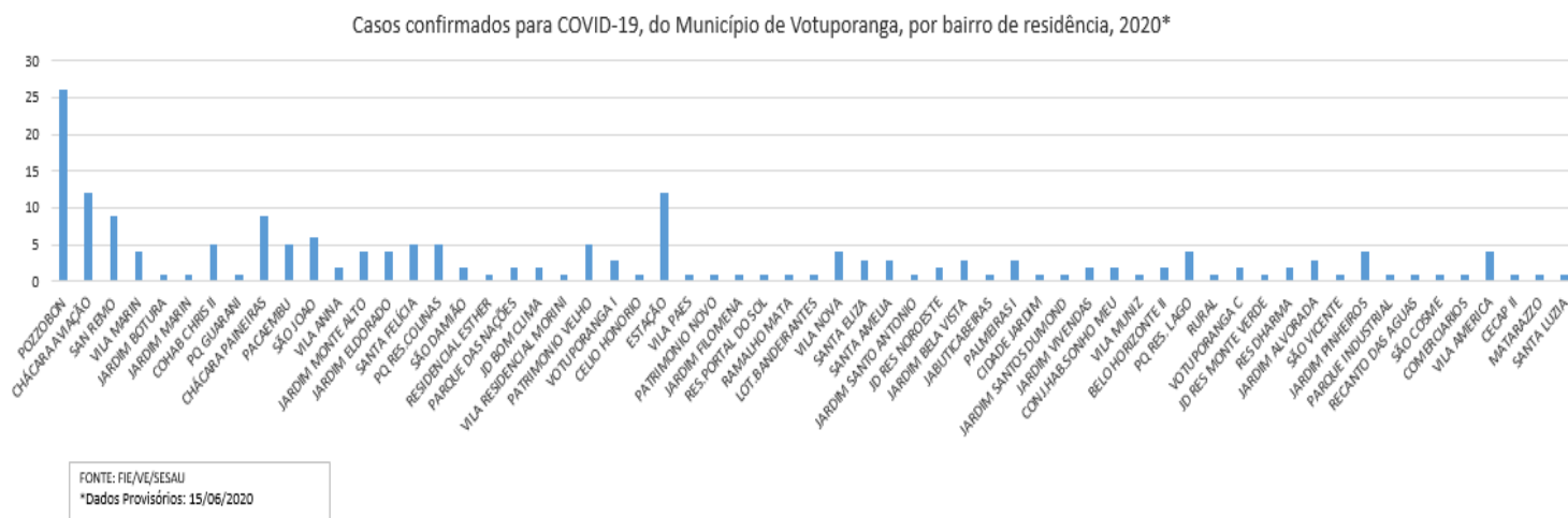
Gráfico 1 - Distribuição dos casos Positivos para COVID-19, residentes no Município de Votuporanga, por bairro, período Março, Abril, Maio e Junho/2020

Na tabela 2 é apresentado o total de Profissionais de Saúde notificados como suspeitos de COVID-19, que aguardam resultado de exame, por faixa etária.